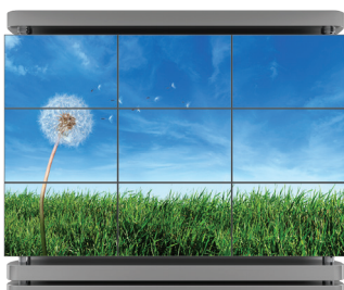
ビデオウォールディスプレイ