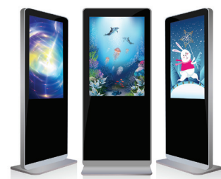
デジタルサイネージ